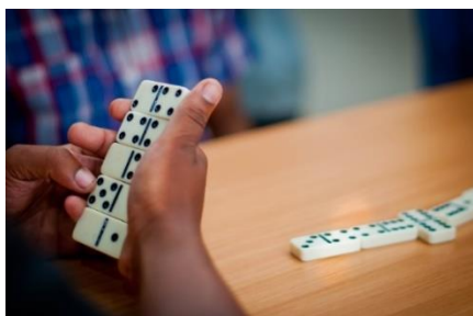
Ruimte voor ontspanning

In 2018 is de dienstverlening op het gebied van gezondheid en onderwijs uitgebreid. Er is een mobiele kliniek opgezet, een extra parttime verpleegkundige aangesteld en er zijn verschillende acties rondom preventieve gezondheid ontwikkeld. Daarnaast zijn de sportfaciliteiten verbeterd. Momenteel wordt er hard gewerkt aan een volgend project dat de gemeenschap heeft aangedragen; een tehuis voor senioren en gepensioneerden.