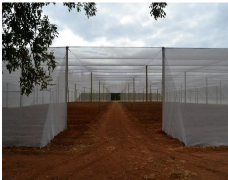
Beginfase van de groentetuin

Nadat basisfaciliteiten zoals crèches en klinieken gerealiseerd waren, wordt er geïnvesteerd in trainings- en opleidingscentra waar mensen zich persoonlijk verder kunnen ontwikkelen en specifieke vaardigheden kunnen leren. Denk aan timmeren, lassen, handwerken, naaien en het opzetten van een groentetuin. Hierdoor zijn de kansen van mensen op de arbeidsmarkt gegroeid en kunnen ze producten maken of verbouwen en verkopen voor extra inkomen. Een voorbeeld zijn de handgemaakte plukmanden of werkkleding die verkocht worden aan de leverancier.