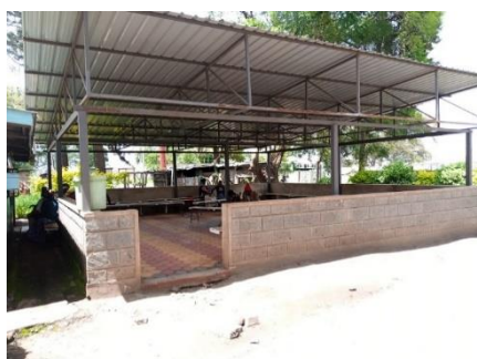
De overdekte wachtruimte

In het gebied ontbrak een bevallingsfaciliteit. In 2018 heeft AAA Growers dit besproken met de overheid en samen met de Representing Bodies (RB) is besloten dit aan te pakken. Om de gezondheidszorg in de regio te verbeteren, heeft de provinciale overheid de toegangswegen in de directe omgeving van het centrum verbeterd. Er is een kraamkliniek gebouwd die een veilige en comfortabele omgeving biedt voor moeder en kind tijdens de bevalling. Er vinden meer dan 100 bevallingen per maand plaats. Bij de apotheek is een schaduwruimte gebouwd, zodat mensen die lang moeten wachten niet langer in de extreme warmte staan.