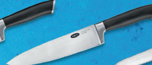
Koksmes Van grof en groot naar klein en fijn.

5.99 + volle spaarkaart Adviesprijs 54.95