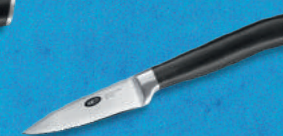
Schilmes Groente en fruit hebben zó hun jasje uit.

3.99 + volle spaarkaart Adviesprijs 24.95