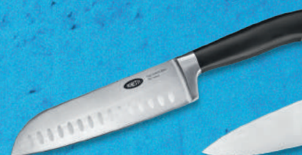
Santoku mes De alleskunner uit de Aziatische keuken.

5.99 + volle spaarkaart Adviesprijs 54.95