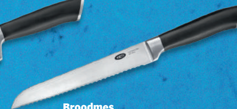
Broodmes Snijd ieder brood zo makkelijk als een zacht wit bolletje.

5.99 + volle spaarkaart Adviesprijs 54.95