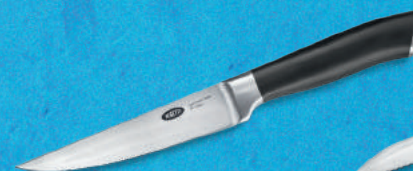
Vleesmes Fileren, trancheren... deze gaat je alles leren.

5.99 + volle spaarkaart Adviesprijs 44.95