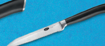
Universeel mes De compacte uitblikker in je keuken.

5.99 + volle spaarkaart Adviesprijs 44.95